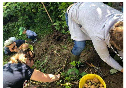
Im KiTa-Garten Kartoffeln ernten