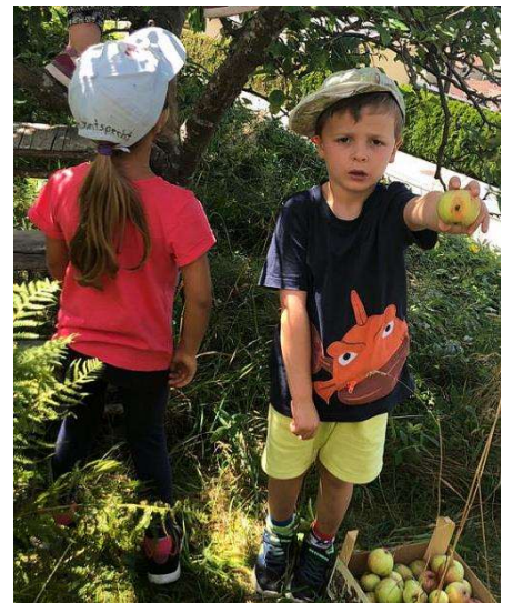
Im KiTa-Garten Äpfel und Birnen pflücken